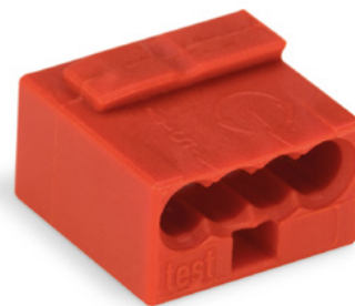
Złączka mikro WAGO serii 243

jące na podłączenie od 2 do 8 przewodów na jednym potencjale. Występują w wersji cztero i ośmioprzewodowej, w kilku wersjach kolorystycznych. Można je ze sobą dowolnie łączyć (mechanicznie, bez połączenia elektrycznego pomiędzy złączkami) lub zainstalować na szynie DIN przy pomocy adaptera.