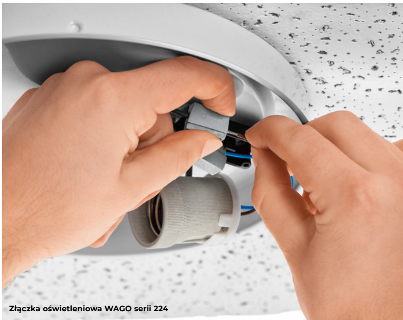
Złączka oświetleniowa WAGO serii 224

opraw oświetleniowych, czy przedłużania przewodów głośnikowych. Możliwość zastosowania akcesoryjnych osłon żelowych Wago Gelbox sprawia, że doskonale nadadzą się również do połączeń w instalacjach oświetlenia zewnętrznego, zasilania infrastruktury ogrodowej, fontann, basenów itp.